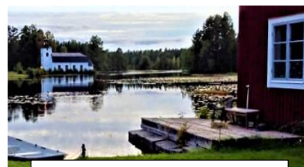
Café Lugnet med B&B