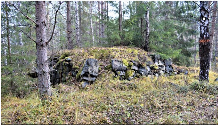
Rödängs gruvor GPS 60.297148 16.677761