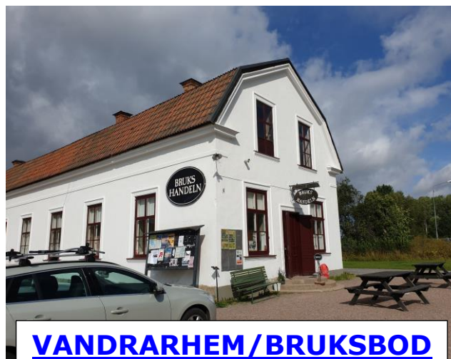
VANDRARHEM / BRUKSBOD