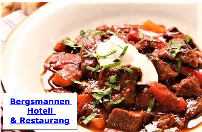
Bergsmannen Hotell & Restaurang