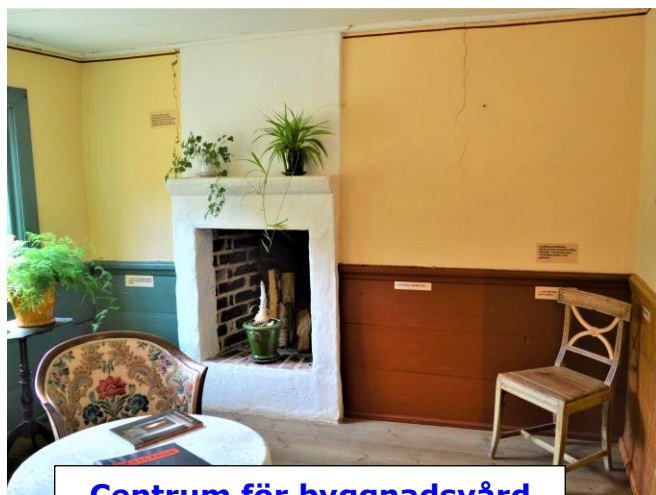
Centrum för byggnadsvård