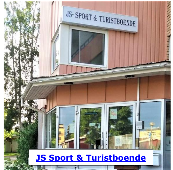
JS Sport & Turistboende