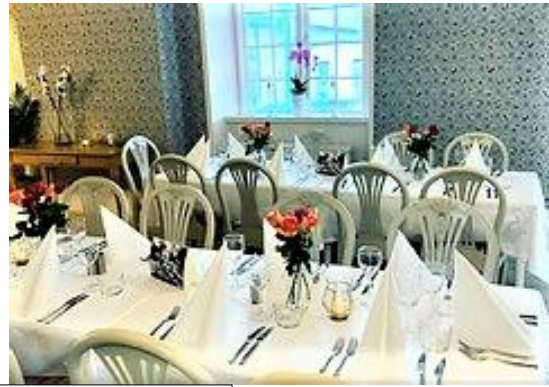
Gysinge Vårdshus & Hotell