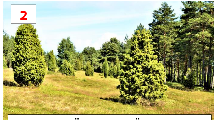
SÖRBY GRAVFÄLT med nära 100 gravhögar och stensättningar